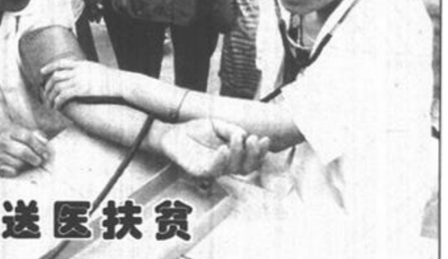
白衣天使送医扶贫

胜利油田博士后工作站建成并正式启动 《胜利日报》消息九月十四日，胜利油田博士后工作站建站暨正式启动。该站是博士后工作站与企业联合建立的第一个博士后工作站。在全省仅有的五家企业获得与高校联合博士后工作站的殊荣。(王正锋 刘斌)